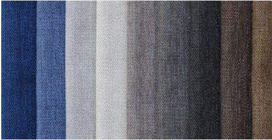
Tela para tu Hamaca