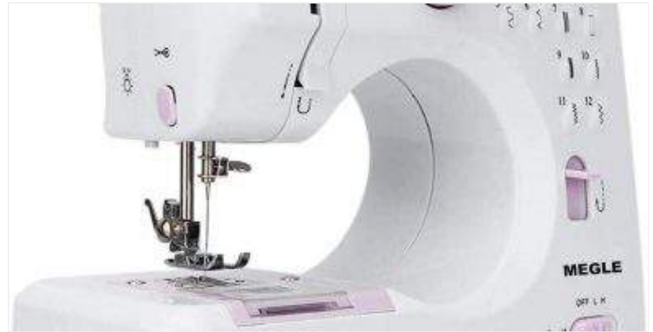
Máquinas para coser tu Hamaca