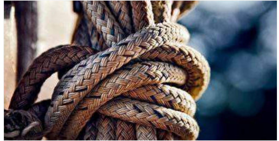
Cuerda para colgar tu Hamaca